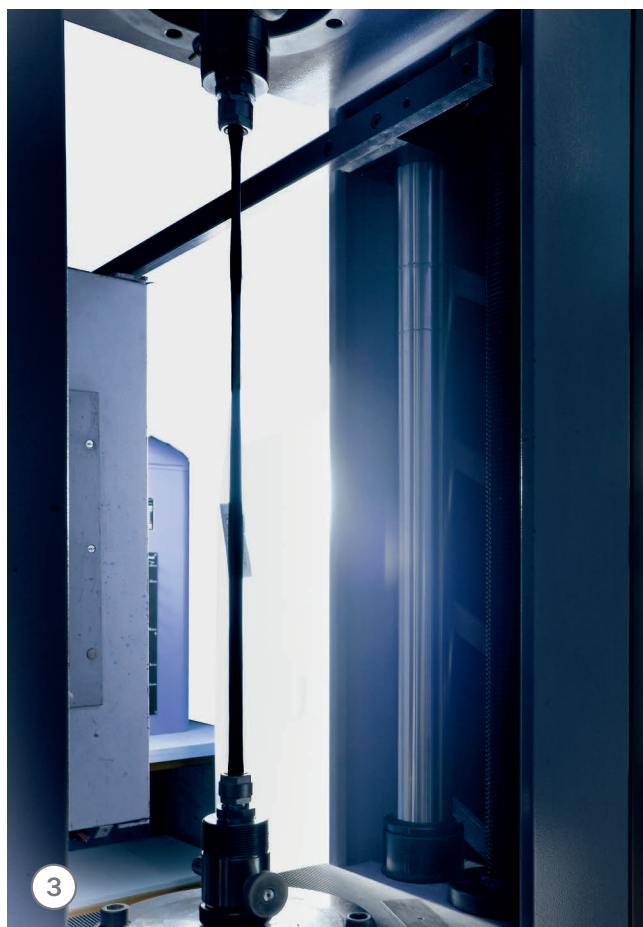
(1) Установка для проверки прочности соединения труб, (2) 3D сканер для проверки фитингов TECElogo, (3) Испытание трубы TECElogo на растяжение.

В целях обеспечения высокого качества продукции исследовательским центром TECE постоянно осуществляется контроль качества системы TECElogo посредством тестов и испытаний.