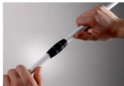
...соединяем трубу и фитинг.