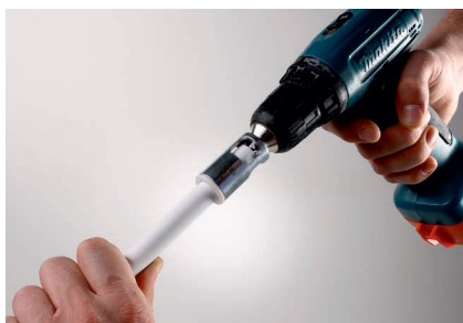
...калибруем, снимаем фаску...