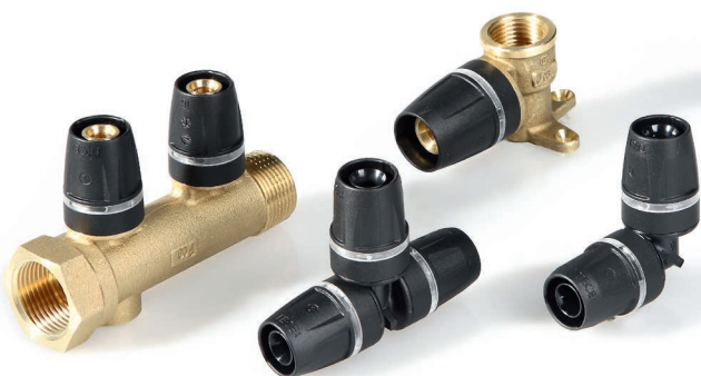
TECElogo – пластиковые фитинги из PPSU TECElogo – резьбовые фитинги из латуни