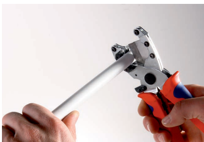
Обрезаем трубу при помощи труборезных ножниц...

Соединение производится без использования запрессовочного инструмента. Для обработки используются только ножницы для резки труб и калибратор. Обработанная этими инструментами труба просто и легко вставляется в фитинг.