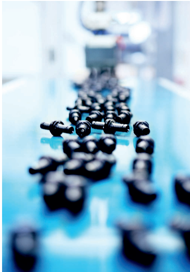
Производство фитингов и металлополимерной многослойной трубы ТЕСЕlogo.